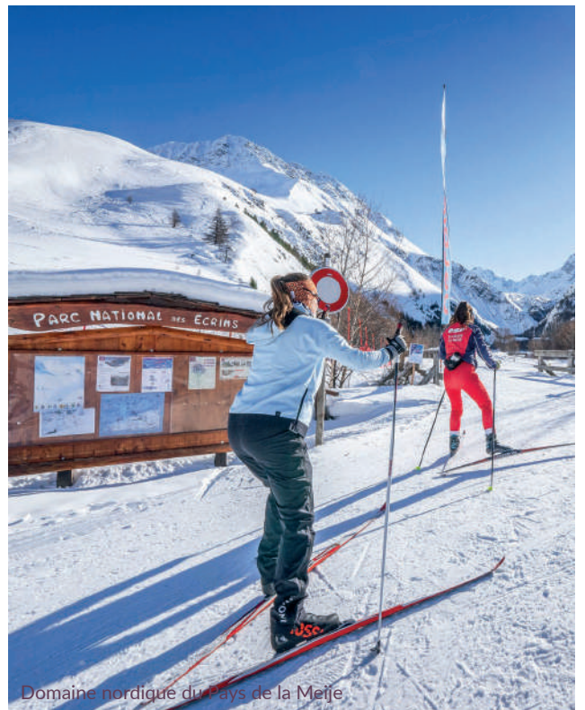
Domaine nordique du Pays de la Meije