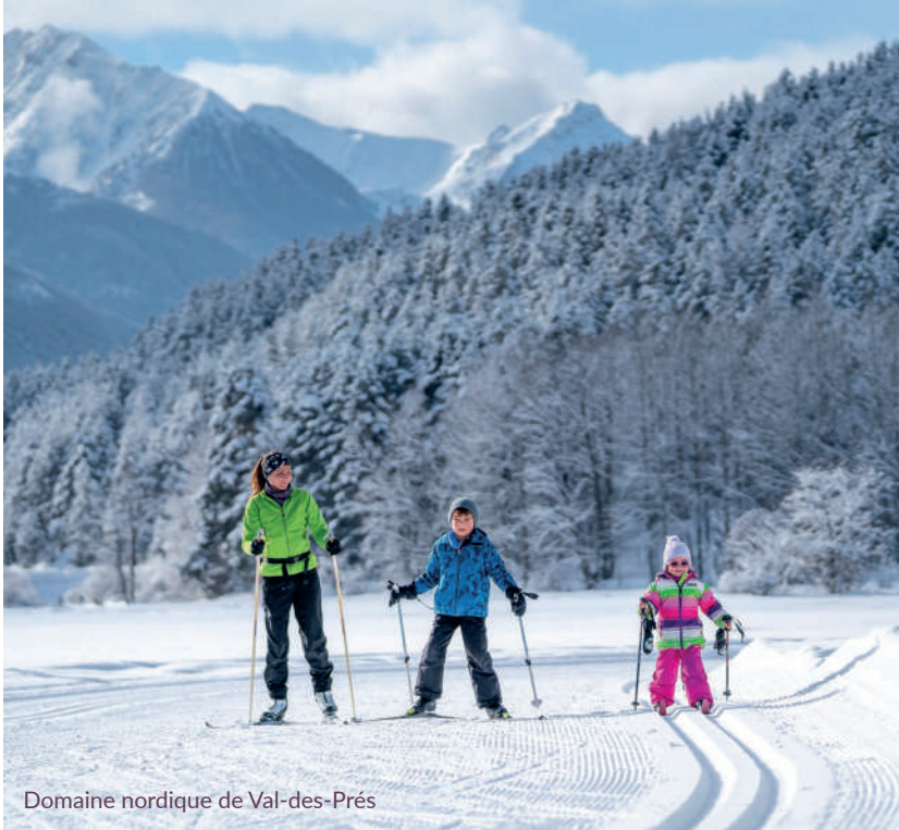
Domaine nordique de Val-des-Prés