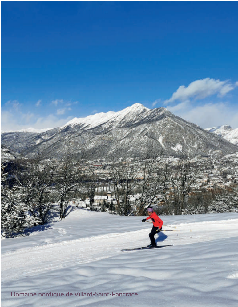
Domaine nordique de Villard-Saint-Pancrace