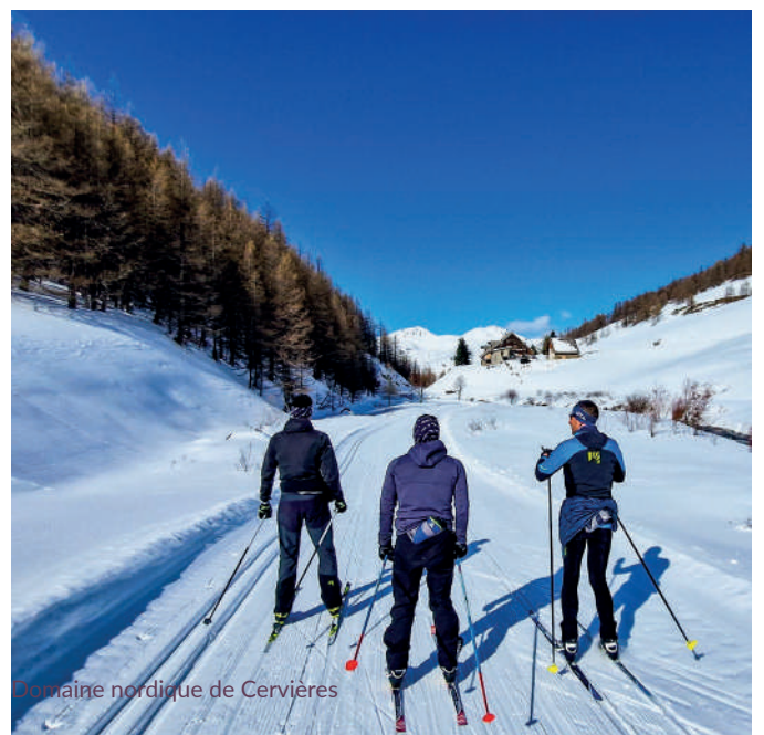
Domaine nordique de Cervières